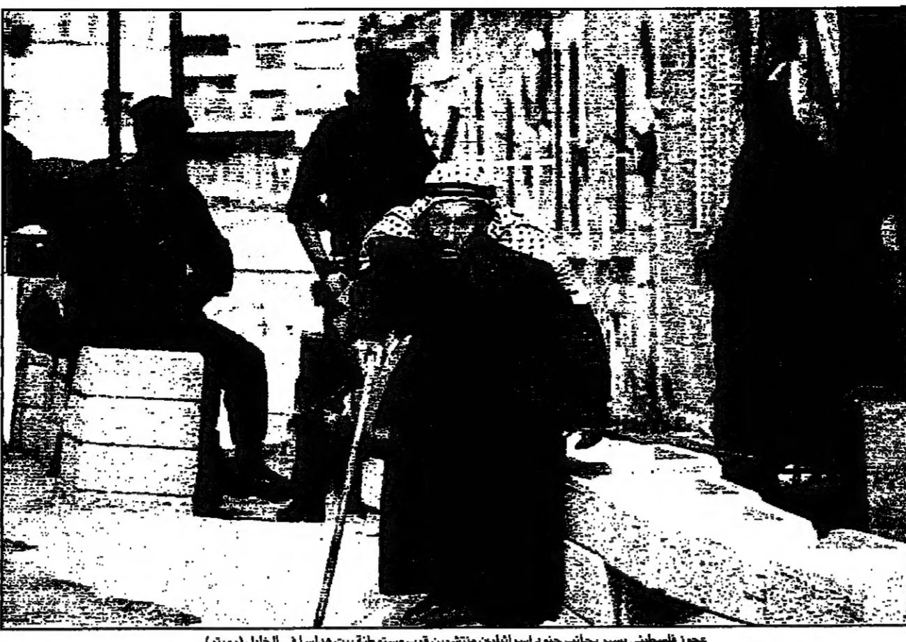
عزور فلسطيني يسير بجانب جنود اسرائيليين منتشرين قرب مستوطنة بيت هداسا في الخليل

القسم - من تأجيل استئناف المفاوضات مع منظمة التحرير الفلسطينية القسم - من تأجيل استئناف المفاوضات مع منظمة التحرير الفلسطينية القسم - من تأجيل استئناف المفاوضات مع منظمة التحرير الفلسطينية